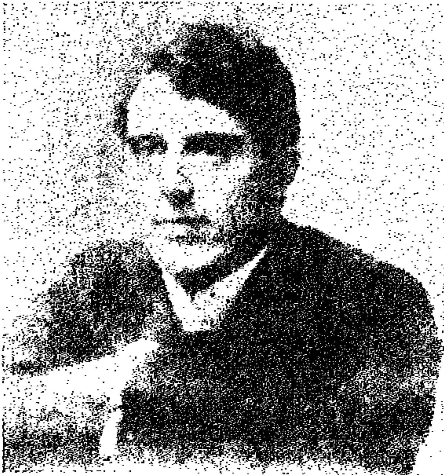
تشيرو، قارىء الكف الحديث الذى كتب عدة مراجع عن قراءة الكف.