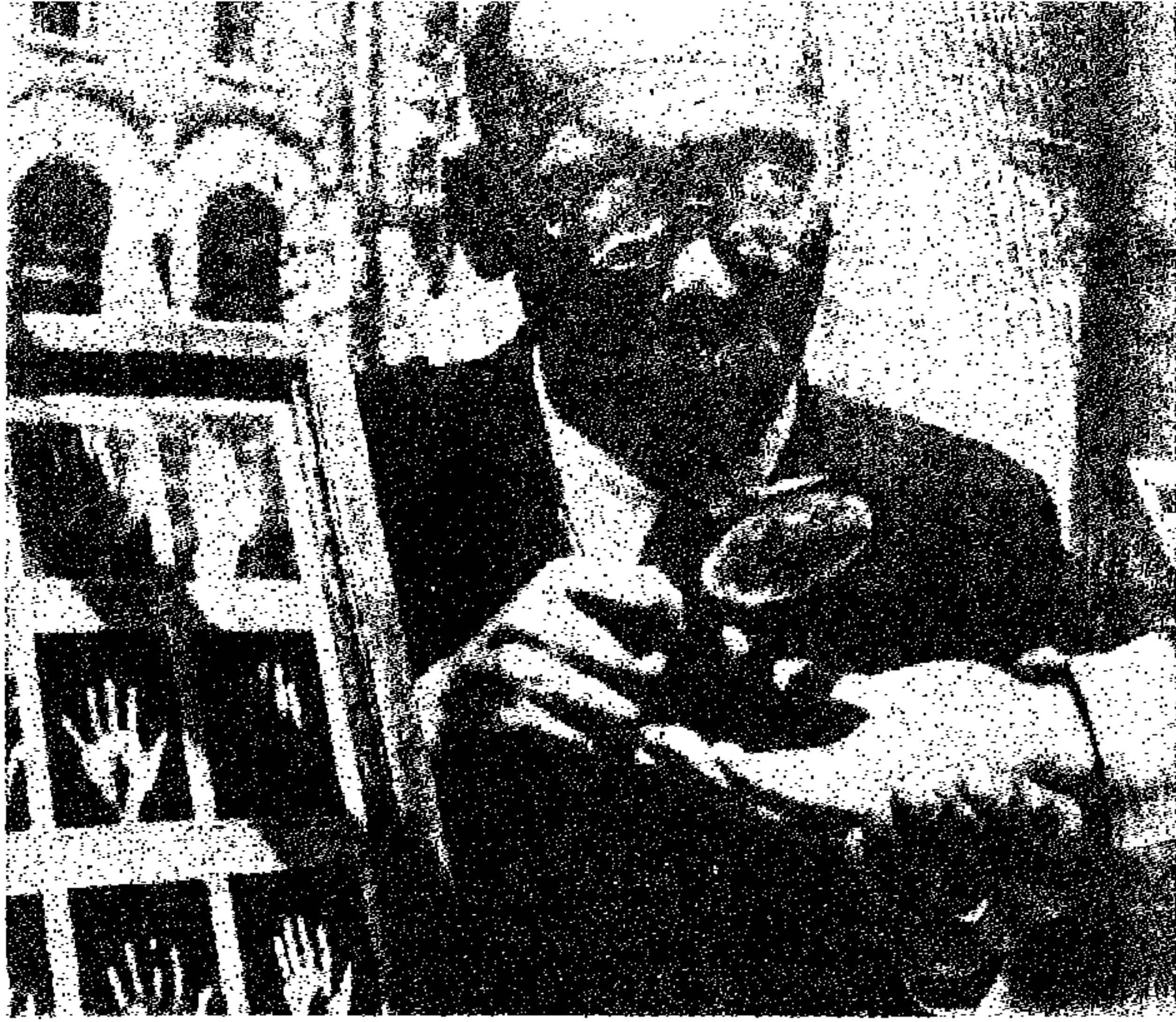
قارىء كف معاصر يدرش كف العميل .